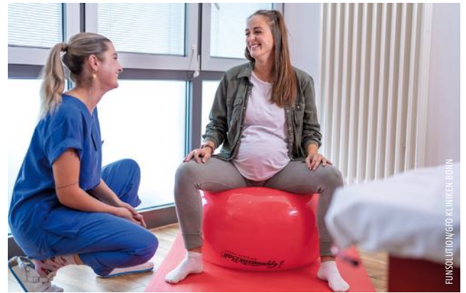
FOTOSOLUTIONEN GFO KLINIKEN BONN